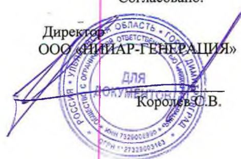
График промывки и опрессовки систем центрального отопления МКД находящихся в эксплуатации ООО «РЭУ», ООО «УК Техник» в западной части города Димитровграда на отопительный период 2017-2018г.