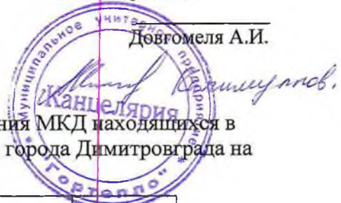
График промывки и опрессовки систем центрального отопления МКД находящихся в эксплуатации ООО «РЭУ», ООО «УК Техник» в старой части города Димитровграда на отопительный сезон 2017-2018 г